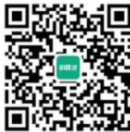
小贤才官方微信平台